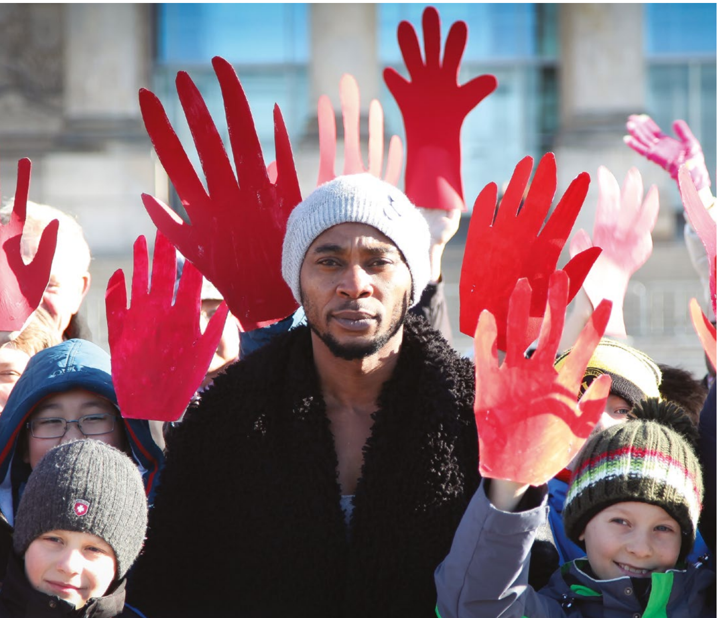
Rote-Hand-Aktion am 12. Februar gegen den Einsatz von Kindersoldat:innen und gegen Waffenexporte. Jedes Jahr protestieren tausende Schüler, Schülerinnen und Erwachsene in vielen Ländern, machen Sie mit! www.redhandday.org