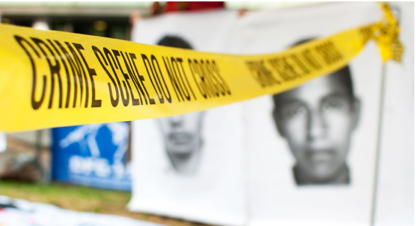
Mahnwache in Stuttgart 2018, Prozessaufakt gegen Heckler und Koch wegen illegaler G36-Exporte nach Mexiko. Eine Nebenklage der Angehörigen der Opfer wurde nicht zugelassen. Illegal gelieferte G36-Gewehre wurden beim sog. Ayotzinapa-Massaker eingesetzt, bei dem 43 Student:innen ermordet wurden.

Weitere Rechtszugangshürden werden erkannt und erfreulicherweise eine Durchsetzung der Ansprüche Betroffener mittels prozessstandschaftlicher Vertretung von anerkannten Verbänden soll laut Eckpunktentwurf ermöglicht werden. 51 Dies ist wichtig, da Betroffene überwiegend Ausländer:innen im Ausland sein werden und daher bei einer Geltendmachung von Ansprüchen vor Gerichten in Deutschland vor einer Vielzahl an Hürden stehen. Ein Verbandsklage-recht im oben genannten Sinne wird hierdurch nicht geschaffen.