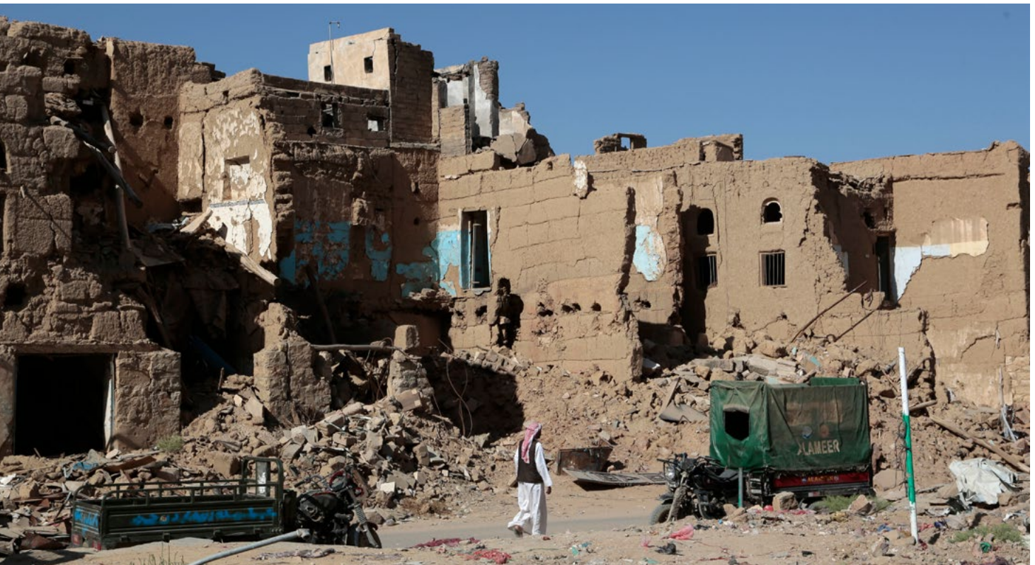
Wohnhäuser in Sa'da (Jemen), die durch Luftschläge der von Saudi-Arabien und Vereinigten Arabischen Emiraten geführten Militärallianz zerstört wurden. Durch diese völkerrechtswidrigen Angriffe sind mehr als 20.000 Zivilist:innen getötet und verstümmelt worden, darunter viele Kinder.