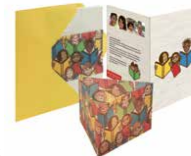
Die Editionskarte finden Sie im Katalog auf Seite 3.

In der Weihnachtszeit erinnern sich viele von uns daran, wie schön es ist, eine persönliche, handgeschriebene Grußkarte zu erhalten – und versenden Weihnachtspost an Verwandte und Freunde. terre des hommes bietet dazu eine bunte Auswahl im aktuellen Grußkartenkatalog an. In diesem Jahr gibt es zudem eine besondere Editionskarte zum Thema »Bildung«.