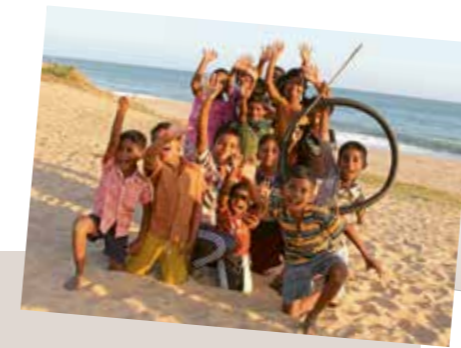
Grußkarte: Kinder am Strand

Diese und andere Grußkarten mit Motiven aus unseren Projektländern finden Sie im Katalog auf Seite 6